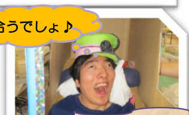
Go to Bus♪