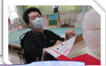
ロケット何個はいるかな？